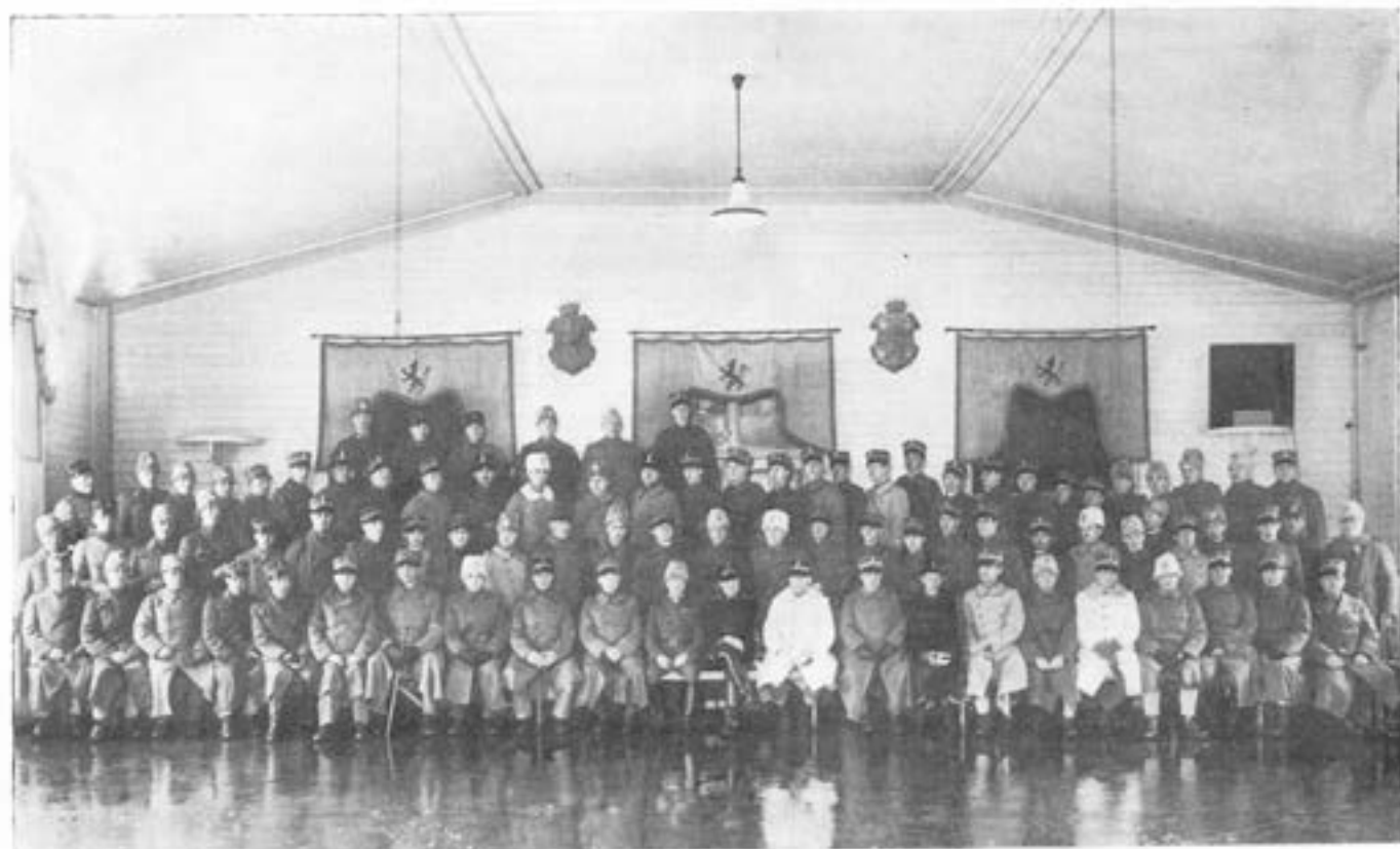
Kungl. Göta trängkärs officers- och underofficerskårer — stat, reservstat, övergångsstat och reserv — för första gången i det närmaste mangrant församlade efter inryckningen till beredskapstjänst i januari 1940.