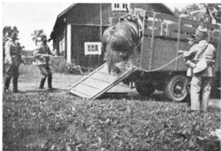
Lastning av hästar.

Samtliga hästar vid kåren äro placerade å anspannskompaniet; sjukvårdskompaniet rekvirerar vid behov vad som erfordras för dess övningar. Hästarna äro dels stamhästar, del ackordshästar. Stamhästarnas antal är 51. Ackordshästarna — de kall blodiga körhästarna — äro 130. De äro kårens egendom, men utackor deras, under den tid de icke behö-