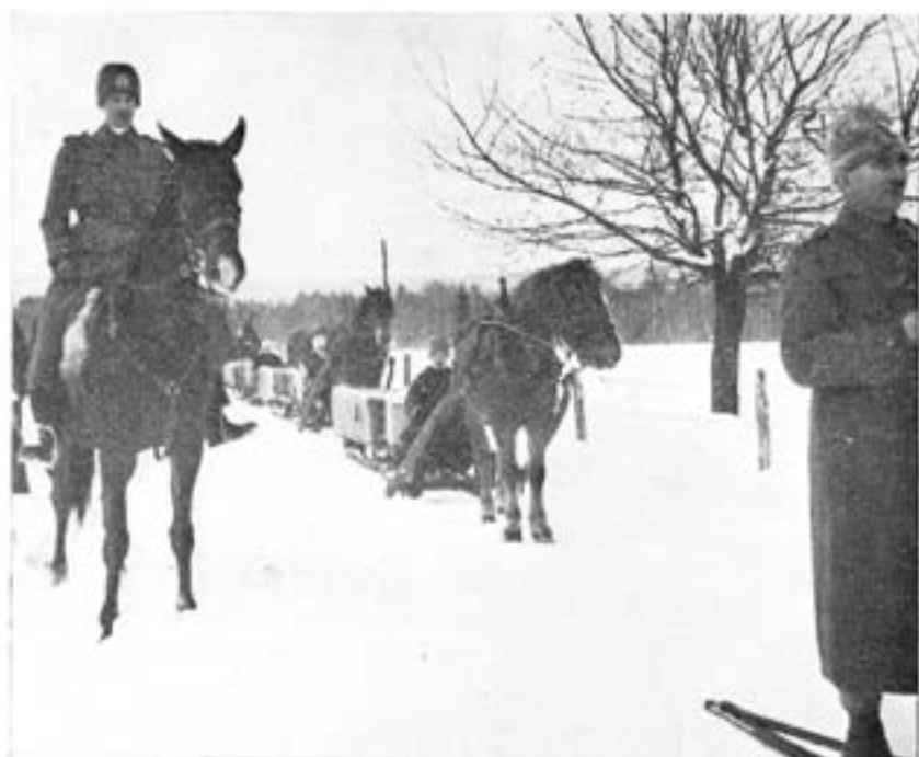
De tunga arméslädarna finns kvar.

För den som lever fjärran från Skövde och endast har föga kontakt med kåren kan det kanske ha sitt intresse att få en redogörelse för hur det ser ut vid T 2 nuförtiden. En sådan redogörelse lämnas här nedan. Den avser "normala förhållanden" och bortser sålunda från beredskapsinkallelserna. För den som fullgjorde sin värnplikt efter 1914 eller 1925 års härordningsbestämmelser är det säkerligen rätt mycket som förändrats.