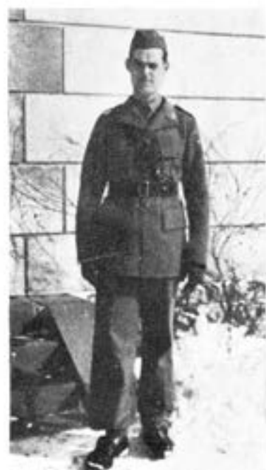
Subalternofficer iförd m/39.

Den nya uniformen utföres i ett kommisstyng av något tunnare kvalitet