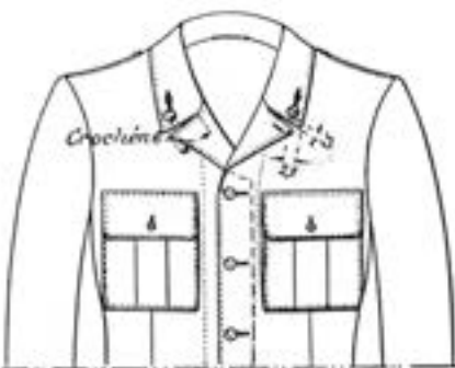
Vapenrock m/39 med uppknäppta slag.

under vissa förhållanden, nämligen vid de mobiliserade förbanden samt vid fredsforband under övningar utom förläggningssorten, när fältdräkt