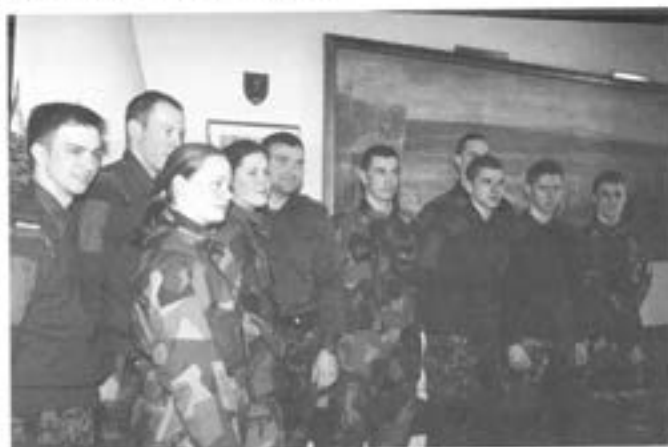
Bilden är tagen då Danskarna gästade T2

Veckan hade varit mycket rolig och lärorik och "ugen var helt enkelt majet dejelig"