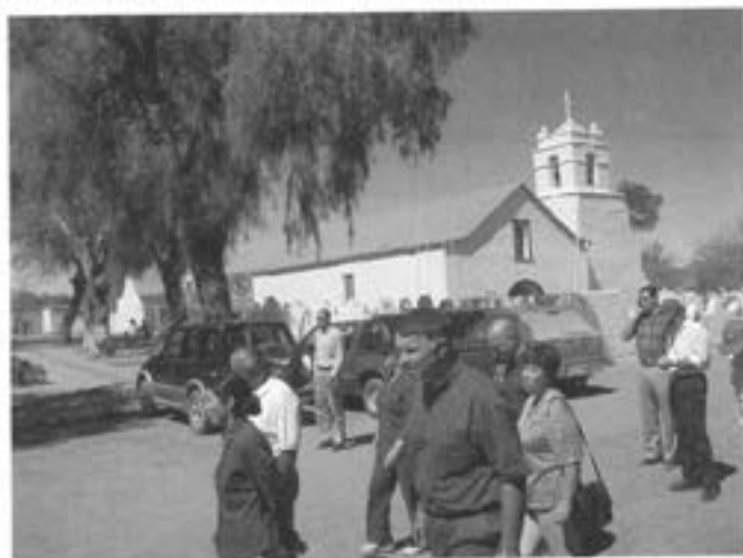
Besöksgruppen i San Pedro de Atacama

Detta avslutar min berättelse från besöket i Chile hösten 2001. Alla intryck och upplevelser kan och kanske inte bör återges på några rader i Götaträngaren. Jag har i denna artikel försökt återge de mest bestående minnena. Till sist vill jag påstå att vi faktiskt har det ganska bra i Sverige.