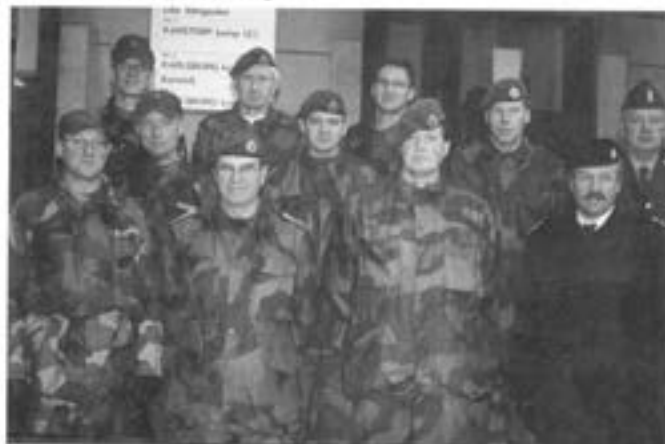
Deltagarna i den Svensk - Norska materielsamarbetsgruppen samlade på T2 i november 2001

Under de tidigare åren har materielsamarbetet bedrivits genom informationsutbyte inom bl.a. områdena förplägnads- och drivmedelsutrustningar, förnödenhetstransport i väglös terräng, transportledning av underhållstransporter. De viktigaste resultaten av det tidigare materielsamarbetet är bl.a. lån av en norsk drivmedelstank 10 m 3 , gemensam teknisk målsättning (TTEM/Kravdokument) för anskaffning av lastväxlarbandvagn 206 med drivmedelstank 2 m 3 . Den gemensamma anskaffningen har fördröjts bl.a. av ej uppfyllda säkerhetskrav och respektive land ominriktning av försvaret. Anskaffning är planerad att ske under perioden 02/03, dock i avsevärt mindre antal än den ursprungliga planeringen.