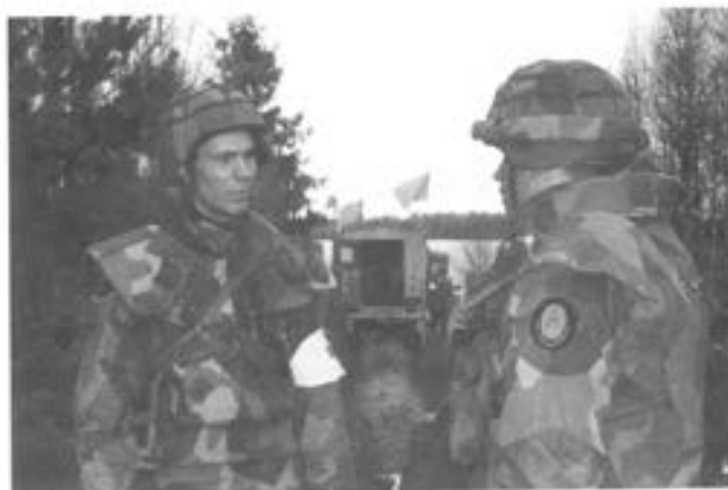
Deltagande minröjare ur Ing 2

Under slutövningen samverkade förbandet såväl med enheter ur P 4 som ur Ing 2.