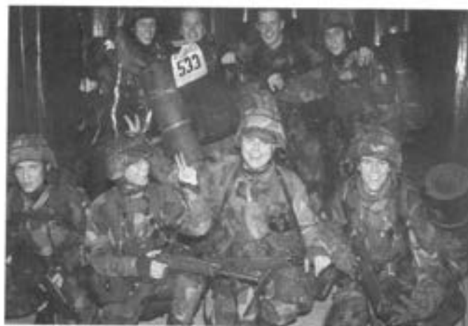
Vinnande grupp, andra trafikgrupp. GRATTIS!

In i det sista var det spännande och ovisst om vilken grupp som skulle avgå med segern, men till målfällan inne i övnings- och vårdhallen på regementet anlände andra gruppen ur Trafikplutonen som segrare. Tätt därefter följde två grupper ur NBC-plutonen. Årets gruppfälttävlan var en riktig strapats och det var med stor heder som grupperna genomförde den.