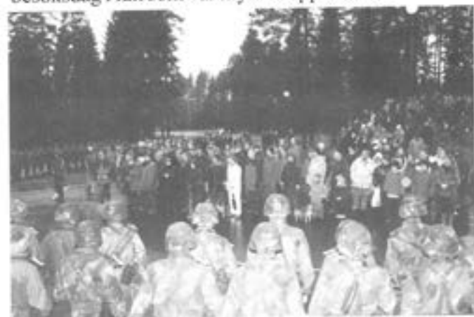
Besöksdagen vid GU-bataljonen i fält

Bataljonsövning 2/3 utgjorde den reella slutövningen för underhållsbataljonens "facktjänst/huvudtjänst". För första gången deltog förbandet i MSS Brigadströvning parallellt med egen understödsövning. Under bataljonsövningen skedde ett flertal omgrupperingar av förbanden och under helgen genomfördes även en besöksdag i fält som var mycket uppskattad.